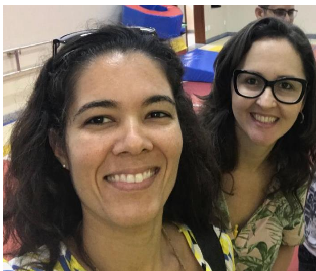
Foto: Ive Cunha Rosinei de Souza, coordenadora do Centro de Reabilitação da OSID

O trabalho desenvolvido na OSID, marcado pelo amor e entrega aos assistidos, foi importante para que a FURC se mantesse firme no propósito de dar continuidade aos seus serviços.